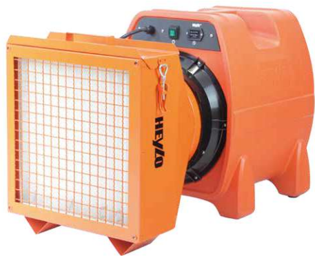
Staub-/Farbstop 3000 ab Seite 102.